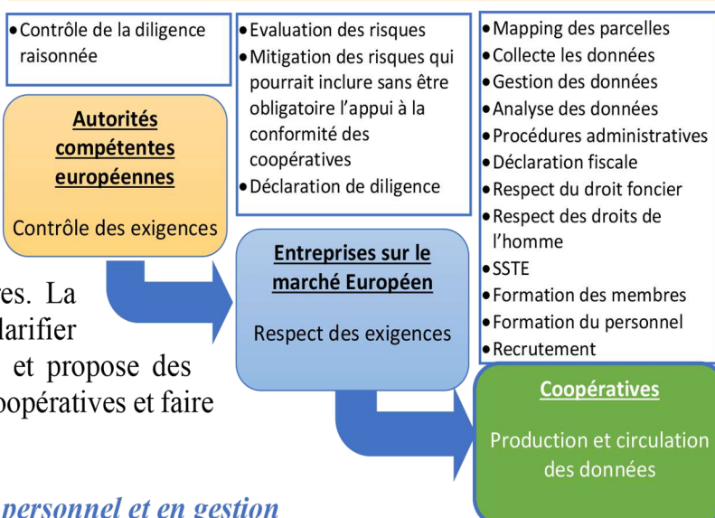
Figure 1: Les charges de l'EUDR vers les coopératives

Introduction : Le Règlement de l'Union Européenne sur la Déforestation impose aux partenaires commerciaux des coopératives de garantir que les produits mis sur le marché européen ne contribuent pas à la déforestation. Cependant, ces produits partent de la parcelle du producteur, à la coopérative avant d'atteindre l'exportateur. Pour les coopératives, les implications sont dès lors d'ordre organisationnels, techniques et surtout financières. La présente note de politique établit l'urgence de clarifier les coûts réels du RDUE pour les coopératives et propose des mesures pour faciliter la mise en conformité des coopératives et faire face aux coûts supplémentaires.